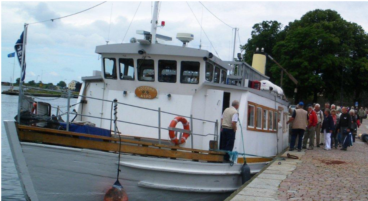
Mf Södern II vid Kungsbron i Karlskrona