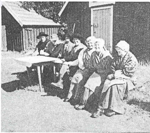
Ett glatt gäng vid Torhamns fiskebodas - (Foto Knut Andersson)

Härmed lämnar vi sjöstäderna för denna gång.