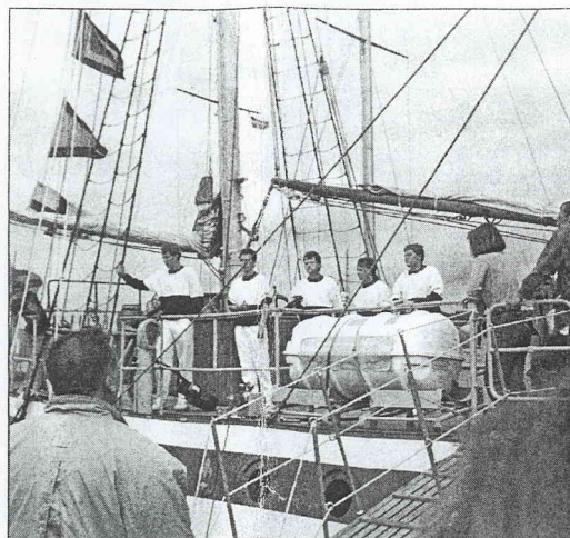
Polska sjömän sjunger från däck.

kamera och tar några foton. Lördagen och söndagen gav mig alltid något tillfälle – med bra ljusförhållanden för fotografering!