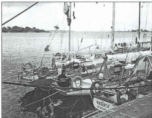
En del av de mindre båtarna i Karlskrona.

Inkommen till Karlskrona fattar jag min kära