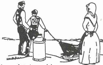
Beredda att börja rodden